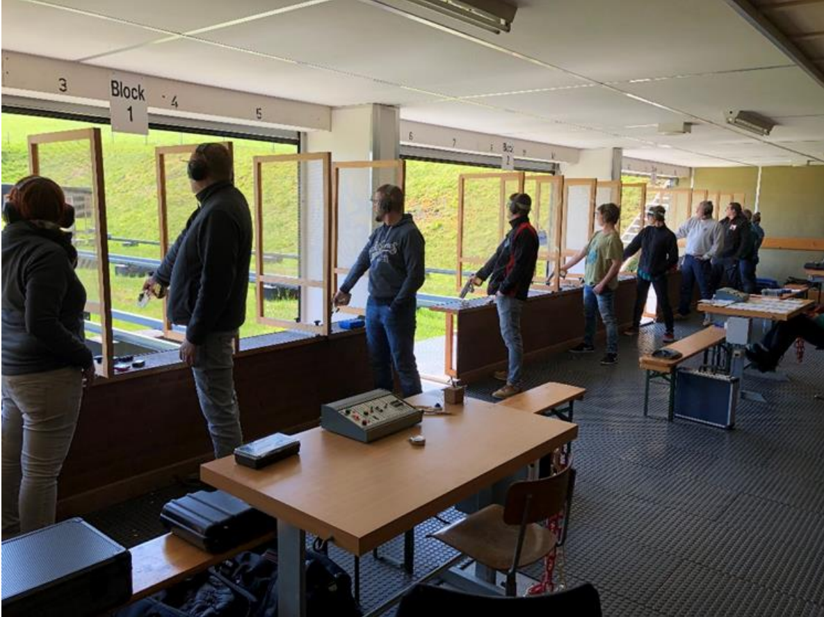
Gemeinsames Training der Pistolen Nachwuchsschützen und der Leistungssport-Schützen Pistole des SG KSV