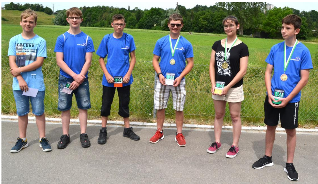
Pistolen-Nachwuchs am St. Galler Jugendtag