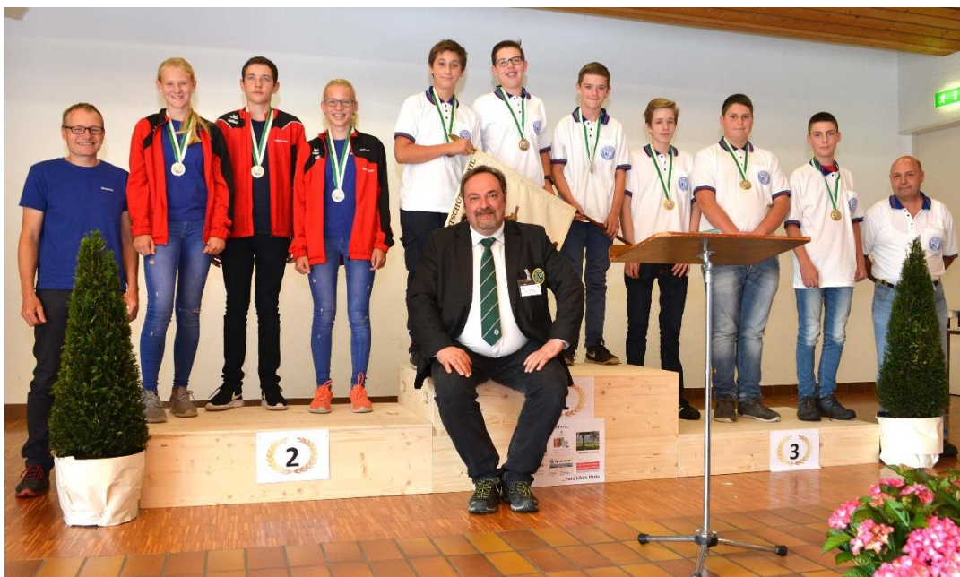
Podest Jugendliche Kantonalfinal GM v.l.; Weesen SV, Wil Stadt 1, Wil Stadt 2

Wenn es eine Schwierigkeit bei einem Amtsantritt gibt, dann die, dass der Vorgänger grosse Spuren hinterlassen hat! Für das erste Jahr war mein Ziel, so wenige Fehler wie möglich und so viele Erfahrungen wie nötig zu machen. Grossmehrheitlich bin ich mit dem Erreichten zufrieden. Aber es gilt für mich und somit für den ganzen Nachwuchsbereich neue Wege zu beschreiten.