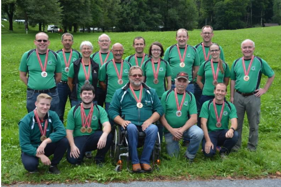
Medaillengewinner am Ständematch KFS Glarus

Der St. Galler Kantonschützenverband gratuliert seinen Machtschützen für die super Leistung beim Ostschweizer Ständematch am Kantonalen Schützenfest in Glarus.