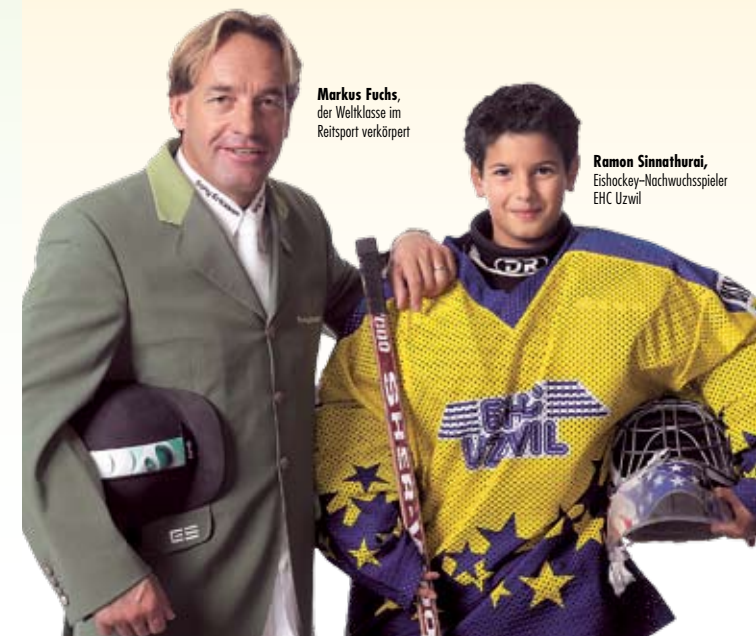
Markus Fuchs, der Weltklasse im Reitersport verkörpert