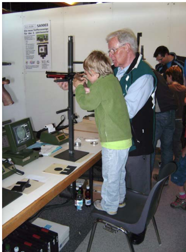
Keiner zu klein, Schütze zu sein!