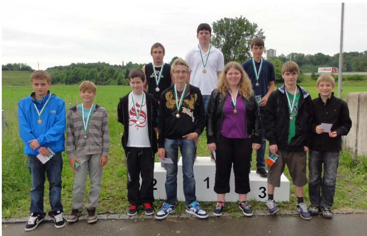
Die ausgezeichneten Teilnehmer der Kat. Pistole U16 am 2. St. Galler Jugendtag

Nach der erfolgreichen Erstaufgabe des St. Galler Jugendtag im letzten Jahr wurde der Wettkampf in diesem Jahr unverändert fortgeführt.