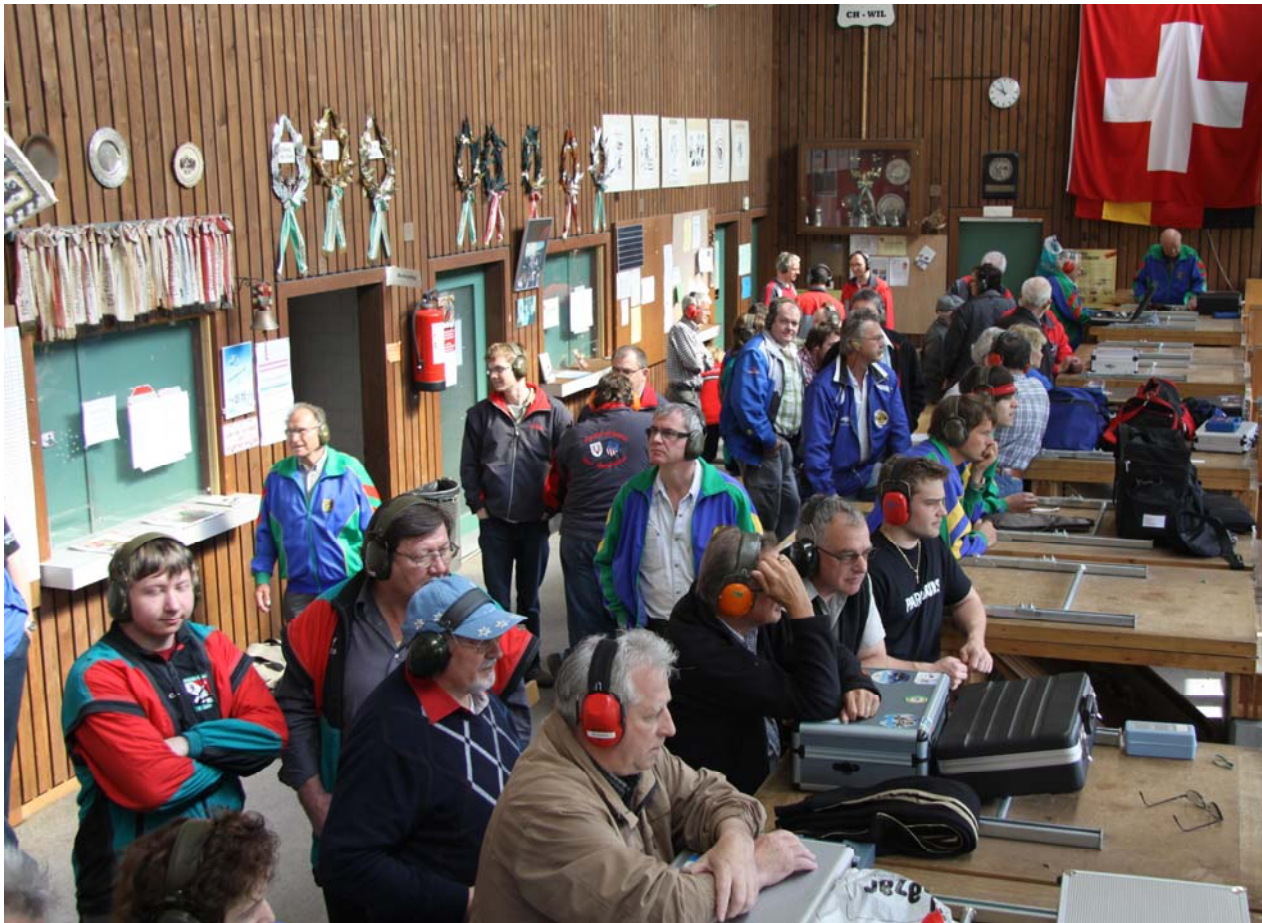
Gespannte Blicke auf die Anzeigetafel, an der automatisch die Resultate der Schützen aktualisiert wurden.

Der kantonale Final der SPGM 50m wurde erstmals auf der neuen elektronischen Trefferanzeige in der Thurau in Wil ausgetragen und war einmal mehr sehr spannungsgeladen. Im Final der besten fünf Gruppen kämpften gleich drei um den Sieg. Im letzten Schuss mussten sich jedoch die Stadtschützen Wil geschlagen geben. Sie konnten den Heimvorteil nicht nutzen und den beiden führenden Gruppen, Altstätten und Sargans, nicht folgen. Punktgleich musste gar ein Stechen über den Sieg entscheiden, was ein deutliches Indiz für die ausgeglichene Leistungsdichte war. Sargans setzt sich vor Altstätten und Wil im Final durch und startet als Kantonsieger in die Hauptrunden. An dieser Stelle ein grosses Lob an die beiden Vereine Sport- und Stadtschützen Wil für die organisatorische Unterstützung.