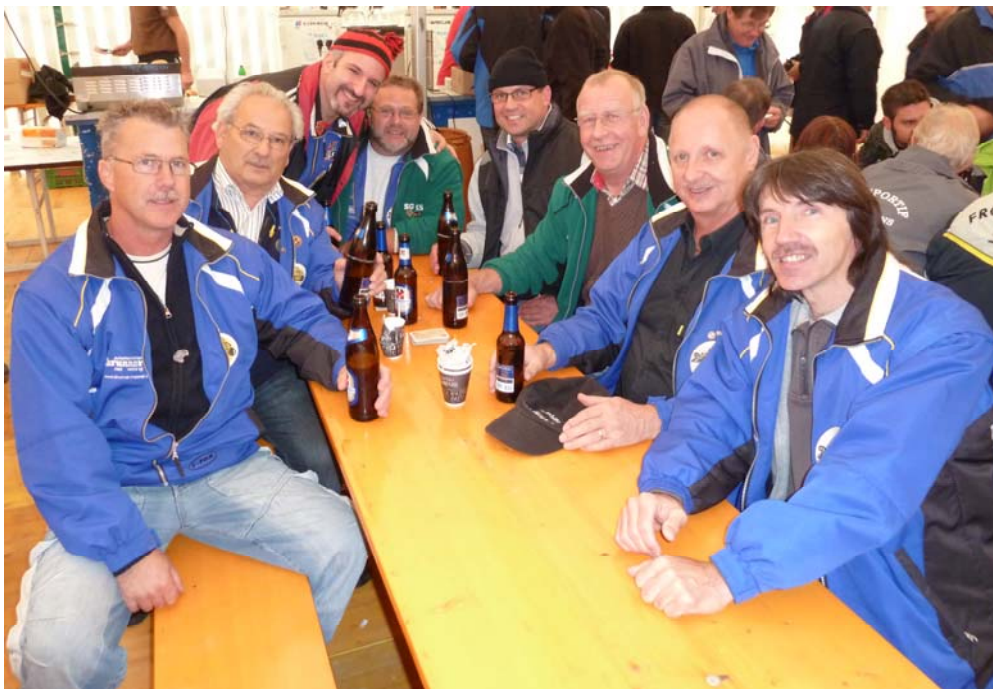
Die Siegergruppe nach erfolgreich absolviertem Wettkampf in Festlaune