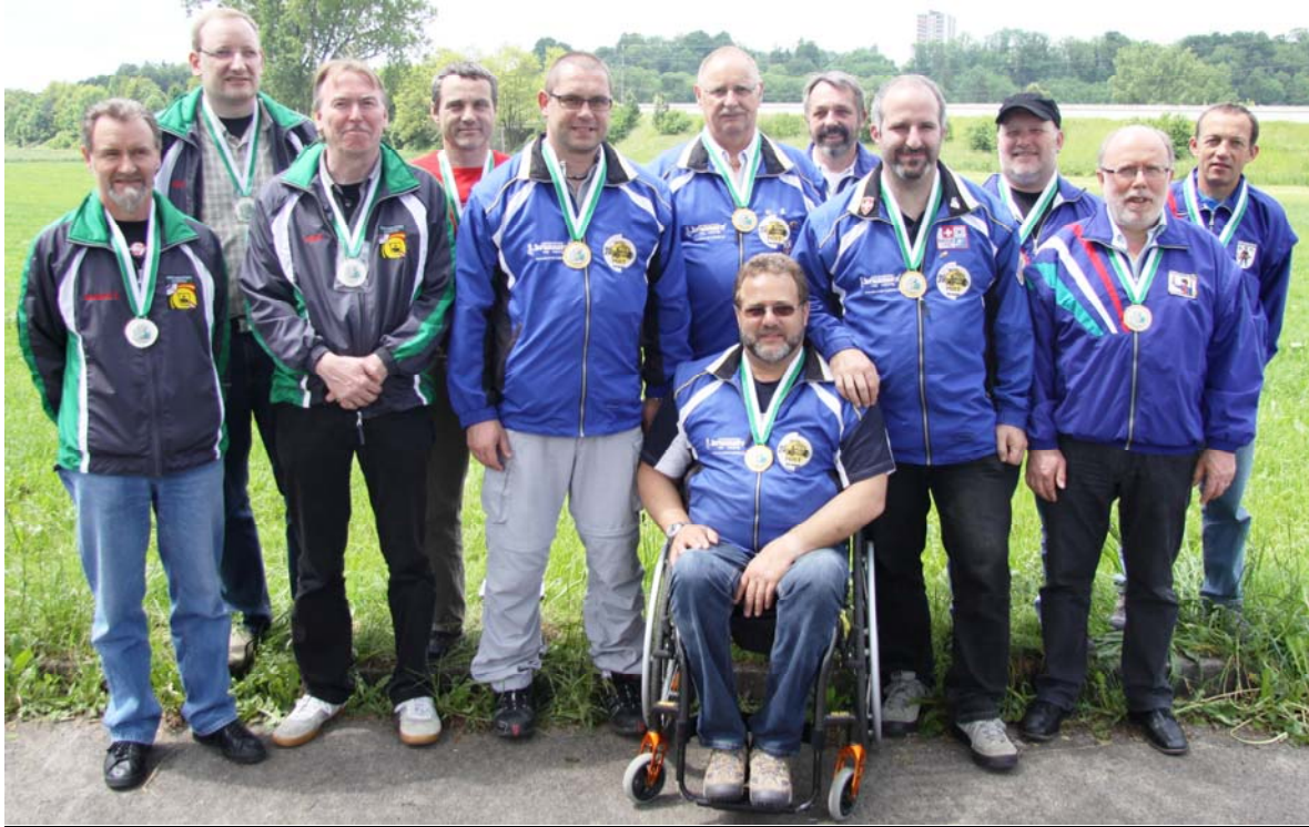
Gruppenbild der Siegerteams